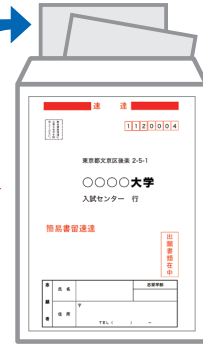
出願書類提出用封筒宛名表